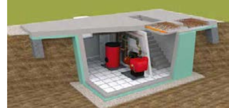
Die Errichtung eines Fertiggellers auf der Baustelle geht dank des hohen Vorfertigungsgrades schnell vonstatten – in der Regel innerhalb von maximal drei bis fünf Tagen. Glatthaar Fertiggeller

über eines konventionell gemauerten sind schnell aufgezählt: Der Bauherr profitiert von einem feststehenden Preis und damit gut kalkulierbaren Kosten. Die Vorfertigung im Werk erfolgt witterungsunabhängig, computergestützt in Maßarbeit und stets unter gleich bleibenden Bedingungen, der Aufbau vor Ort erfolgt in kurzer Zeit, in der Regel zwischen drei und fünf Werktagen,