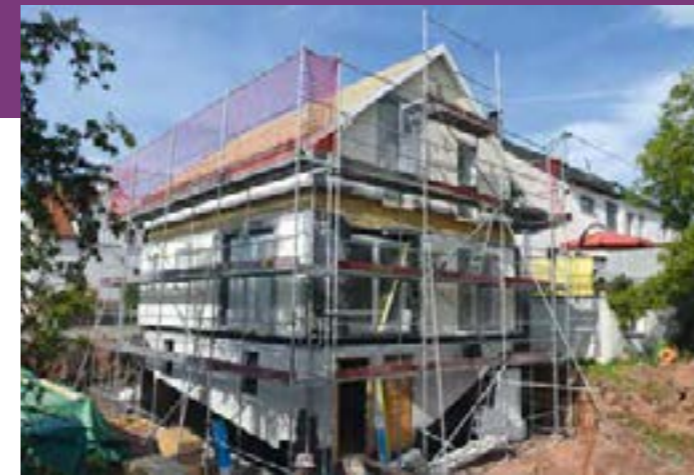
Ein Wohnkeller bringt enormen Mehrgewinn an Platz, insbesondere bei einem Grundstück in Hanglage. Glatthaar Fertiggeller

Abhängig von der jeweils individuellen Gegebenheit erhält der Bauherr ein Angebot. Die Vorteile eines Fertiggellers gegen-