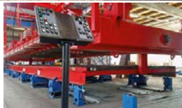
Bei der „Hochzeit“ werden zwei deckungsgleiche Wandschalen computergesteuert zu einem Element zusammengefügt. GÜF Gütegemeinschaft Fertiggeller

Mit modernen Fertiggellern holen Sie das Maximale aus wertvollen Grundstücken heraus: für eine anspruchsvolle Nutzung ohne Abstriche.