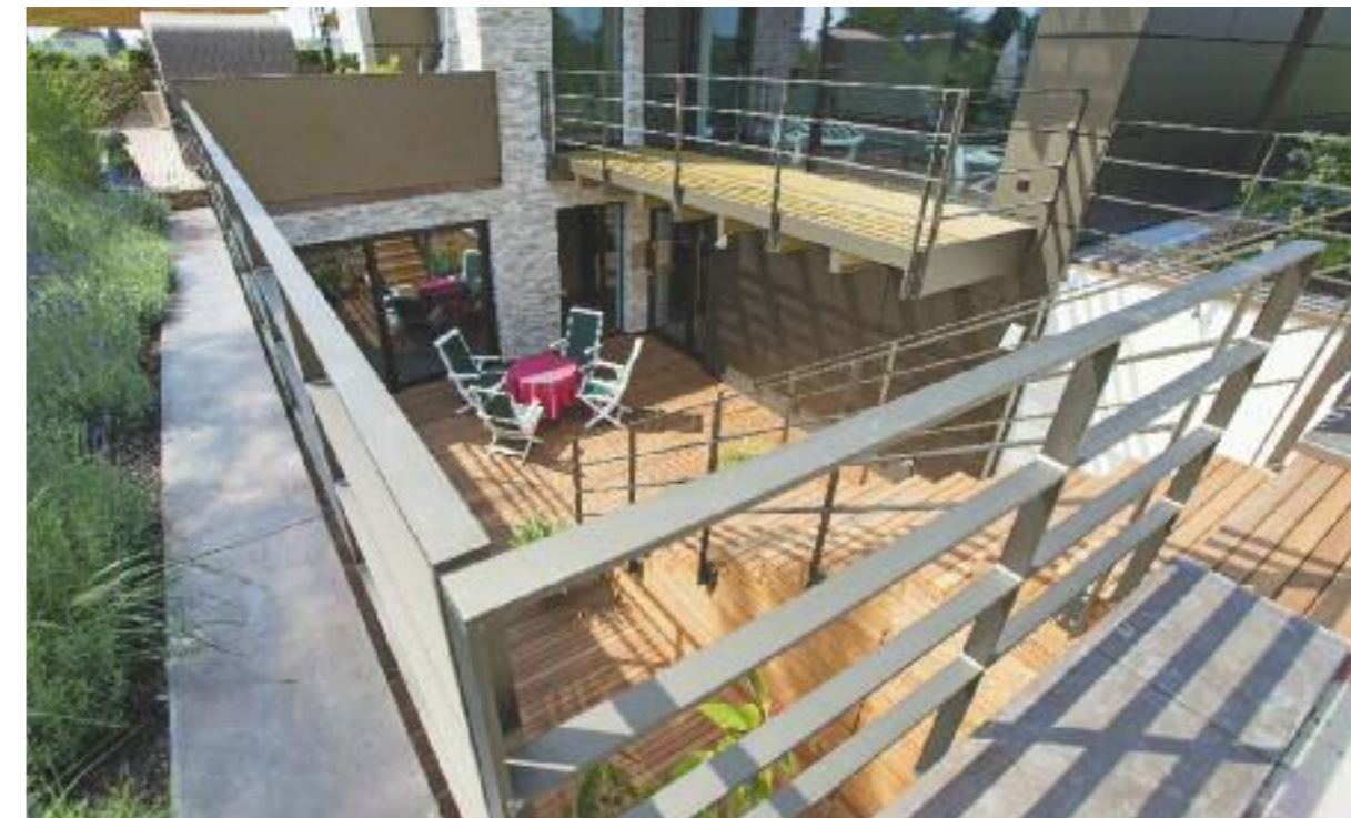
Hier erhielt die Einliegerwohnung im Untergeschoss eine großzügige Verglasung für reichlich Tageslicht und einen geschützten Lichthof als Freisitz. Glatthaar