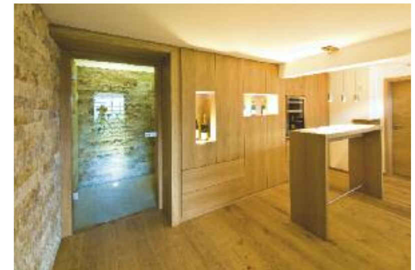
Möglichkeiten für die Einrichtung und Nutzung der Räume im Untergeschoss gibt es viele. Eine besonders prickelnde zeigt dieses Beispiel einer Champagner-Bar, quasi als moderne Version des früheren Partykellers. Baufritz