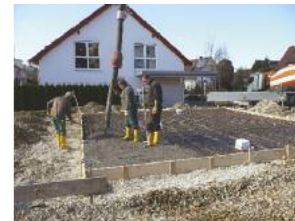
Auf die durchgehende Stahlbewehrung wird der Ortbeton aufgebracht. Knecht

häufig fälschlich ebenfalls „Bodenplatte“ genannt, die sämtliche Gebäudelasten trägt und gleichmäßig auf die gesamte Auflagefläche verteilt. Obwohl für sie mehr Beton und mehr Stahl benötigt wird, ist sie in vielen Fällen günstiger, da einfacher und schneller hergestellt. Der Grundriss kann kleinteilig, die Wandverläufe können kompliziert sein, es müssen ihnen ja keine Streifenfundamente unter einer Bodenplatte folgen. Bei kleineren Gebäuden hält sich zudem der Mehrbedarf an Baumaterial in Grenzen. Gerade auf weichen, nicht besonders tragfähigen Böden ist man mit ihr im Vorteil. In der Baugrube wird zuerst eine Schicht aus Grobkies oder Magerbeton aufgebracht und planiert, die sogenannte Sauberkeitsschicht, darauf eine wasser- und diffusionsdichte Folie, zum