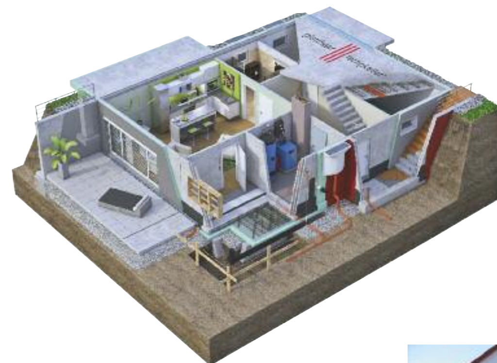
Ein auch unterhalb der Fundamentplatte gedämmter Wohnkeller: Den Kosten eines Kellers steht der höhere Wiederverkaufswert des Hauses gegenüber. Glatthaar

Nachbessern ist nicht, hat man beim Fundament seines Hauses Fehler gemacht. Neben der Solidität muss ebenso der Wärmeschutz beachtet werden, der über die Mindestanforderungen hinausgehen sollte.