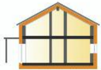
Der Wärmeschutz sollte idealerweise die gesamte Haushülle samt Sohlplatte umfassen, so das Passivhaus Institut in Darmstadt. Passivhaus Institut

finden und setzen die Thermoplatte ein, eine komplett von einer Dämmung unterfangene Sohlplatte. Nur möglich mit absolut und dauerhaft druckfesten und wasserdichten Hartschaum-Dämmplatten, in der Regel aus expandiertem Polystyrol (EPS) oder extrudiertem Polystyrol (XPS). Sie werden auf der Sauberkeitsschicht verlegt und bilden zugleich die verlorene Schalung für den Ortbeton. In der derzeit gültigen EnEV, der Energieeinsparverordnung, ist für die Bodendämmung ein U-Wert von 0,35 \text{ W/m}^2\text{K} gefordert. Mit der Hartschaumisolierung sind laut einiger Hersteller 0,10 \text{ W/m}^2\text{K} zu erreichen (siehe Kasten „U-Wert“).