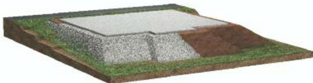
Frostunempfindlicher Schotter schützt bei dieser Ausführung die Bodenplatte. Glatthaar