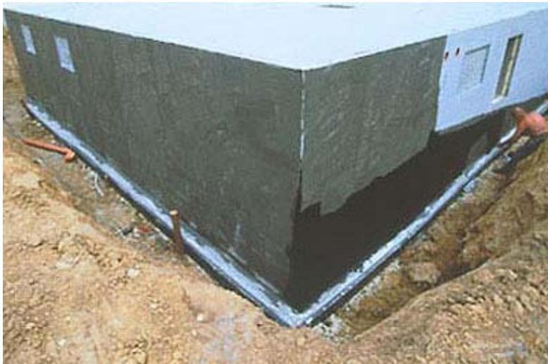
...sowie bei Anschlussarbeiten und beim Innenausbau senkte die Bauherrschaft die Kosten drastisch.