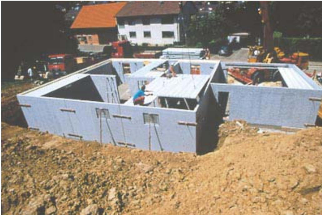
Die Montage des vorgefertigten Beton-Fertigteilkellers erledigten die Keller-Profis an einem Tag.